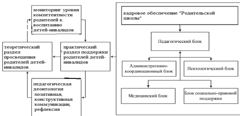
Схема 3. Структура, алгоритм и технология поддержки родителей детей-инвалидов в «Родительской школе»

При оценке преобладающего типа семейного воспитания следует проанализировать такие параметры: эмоциональное принятие ребенка родителями; заинтересованность в ребенке; забота о нем; требовательность к нему; демократизм или авторитаризм в семейных отношениях.