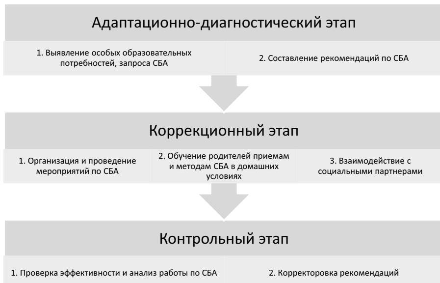
Схема 3. Этапы СБА в ОО